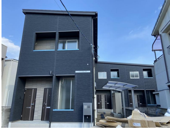
※写真・間取は、現状優先とします。